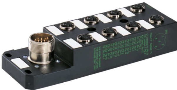
M12-Females 5-pole M23-Plug 19-pole