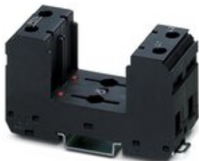
Basiselement für Typ 2-Ableiter der Produktreihe VALVETRAB MS. Ausführung für 2-phasige Stromversorgungen mit PEN-Leiter.

Bitte beachten Sie, dass die hier angegebenen Daten dem Online-Katalog entnommen sind. Die vollständigen Informationen und Daten entnehmen Sie bitte der Anwenderdokumentation. Es gelten die Allgemeinen Nutzungsbedingungen für Internet-Downloads. ( http://phoenixcontact.de/download )