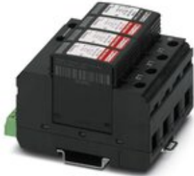
Überspannungsableiter 4-kanalig, zur Montage auf NS 35/7,5, mit Fernmeldekontakt. 230 V AC

Bitte beachten Sie, dass die hier angegebenen Daten dem Online-Katalog entnommen sind. Die vollständigen Informationen und Daten entnehmen Sie bitte der Anwenderdokumentation. Es gelten die Allgemeinen Nutzungsbedingungen für Internet-Downloads. ( http://phoenixcontact.de/download )