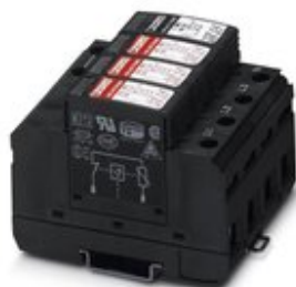
Überspannungsableiter 4-kanalig (in 3+1-Schaltung), zur Montage auf NS 35/7,5, Spannung 230 V AC

Bitte beachten Sie, dass die hier angegebenen Daten dem Online-Katalog entnommen sind. Die vollständigen Informationen und Daten entnehmen Sie bitte der Anwenderdokumentation. Es gelten die Allgemeinen Nutzungsbedingungen für Internet-Downloads. ( http://phoenixcontact.de/download )