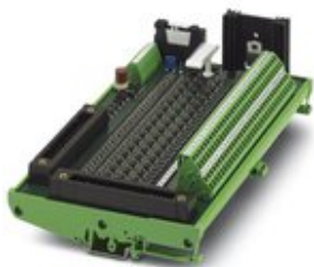
VARIOFACE-Eingabemodul, 32 Kanäle für NAMUR-Nährungsinitiatoren für Yokogawa Eingabebaugruppen ADV151, ADV161.

Bitte beachten Sie, dass die hier angegebenen Daten dem Online-Katalog entnommen sind. Die vollständigen Informationen und Daten entnehmen Sie bitte der Anwenderdokumentation. Es gelten die Allgemeinen Nutzungsbedingungen für Internet-Downloads. ( http://phoenixcontact.de/download )