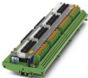
VARIOFACE-Ausgabemodul, 32 Kanäle für Yokogawa Ausgabe-Baugruppen ADV 551, ADV 561.

Bitte beachten Sie, dass die hier angegebenen Daten dem Online-Katalog entnommen sind. Die vollständigen Informationen und Daten entnehmen Sie bitte der Anwenderdokumentation. Es gelten die Allgemeinen Nutzungsbedingungen für Internet-Downloads. ( http://phoenixcontact.de/download )