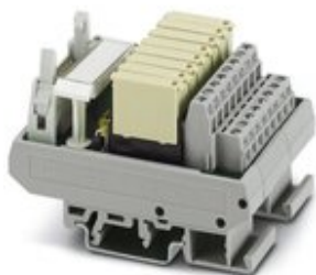
VARIOFACE-Ausgabemodul, mit 8 Miniaturrelais, je 1 Schließer, gesteckt, für 24 V DC (inkl. Relais)

Bitte beachten Sie, dass die hier angegebenen Daten dem Online-Katalog entnommen sind. Die vollständigen Informationen und Daten entnehmen Sie bitte der Anwenderdokumentation. Es gelten die Allgemeinen Nutzungsbedingungen für Internet-Downloads. ( http://phoenixcontact.de/download )