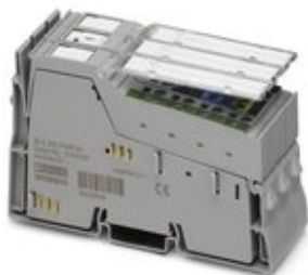
Inline-Einspeiseklemme, komplett mit Zubehör (Anschlussstecker und Beschriftungsfeld), ohne Sicherung, 230 V AC

Bitte beachten Sie, dass die hier angegebenen Daten dem Online-Katalog entnommen sind. Die vollständigen Informationen und Daten entnehmen Sie bitte der Anwenderdokumentation. Es gelten die Allgemeinen Nutzungsbedingungen für Internet-Downloads. ( http://phoenixcontact.de/download )