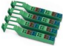
Stecker-Set, für IB IL DI 16, Kupfer, farbig markiert.

Bitte beachten Sie, dass die hier angegebenen Daten dem Online-Katalog entnommen sind. Die vollständigen Informationen und Daten entnehmen Sie bitte der Anwenderdokumentation. Es gelten die Allgemeinen Nutzungsbedingungen für Internet-Downloads. ( http://phoenixcontact.de/download )