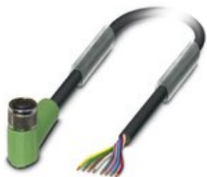
Sensor-/Aktor-Kabel, 8-polig, PUR halogenfrei, schwarzgrau RAL 7021, freies Leitungsende, auf Buchse gewinkelt M8, Kabellänge: 3 m

Bitte beachten Sie, dass die hier angegebenen Daten dem Online-Katalog entnommen sind. Die vollständigen Informationen und Daten entnehmen Sie bitte der Anwenderdokumentation. Es gelten die Allgemeinen Nutzungsbedingungen für Internet-Downloads. ( http://phoenixcontact.de/download )