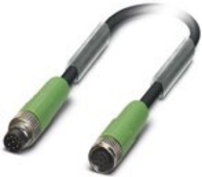
Sensor-/Aktor-Kabel, 8-polig, PUR halogenfrei, schwarzgrau RAL 7021, Stecker gerade M8, auf Buchse gerade M8, Kabellänge: 3 m

Bitte beachten Sie, dass die hier angegebenen Daten dem Online-Katalog entnommen sind. Die vollständigen Informationen und Daten entnehmen Sie bitte der Anwenderdokumentation. Es gelten die Allgemeinen Nutzungsbedingungen für Internet-Downloads. ( http://phoenixcontact.de/download )