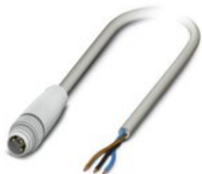
Sensor-/Aktor-Kabel, 3-polig, PP-EPDM halogenfrei, grau RAL 7035, Stecker gerade M8, auf freies Leitungsende, Kabellänge: 1,5 m, Hygienic Design, mit Kunststofffrädel

Bitte beachten Sie, dass die hier angegebenen Daten dem Online-Katalog entnommen sind. Die vollständigen Informationen und Daten entnehmen Sie bitte der Anwenderdokumentation. Es gelten die Allgemeinen Nutzungsbedingungen für Internet-Downloads. ( http://phoenixcontact.de/download )