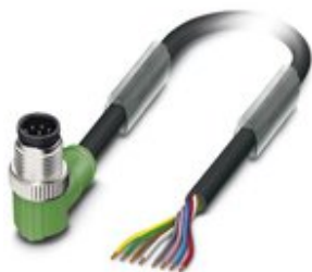
Sensor-/Aktor-Kabel, 8-polig, PVC, schwarz RAL 9005, Stecker gewinkelt M12, Kodierung: A, auf freies Leitungsende, Kabellänge: 1,5 m

Bitte beachten Sie, dass die hier angegebenen Daten dem Online-Katalog entnommen sind. Die vollständigen Informationen und Daten entnehmen Sie bitte der Anwenderdokumentation. Es gelten die Allgemeinen Nutzungsbedingungen für Internet-Downloads. ( http://phoenixcontact.de/download )