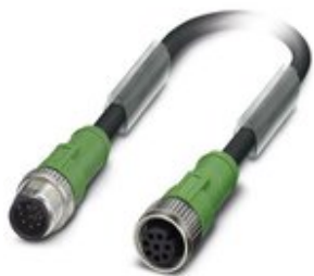
Sensor-/Aktor-Kabel, 8-polig, PVC, schwarz RAL 9005, Stecker gerade M12, Kodierung: A, auf Buchse gerade M12, Kodierung: A, Kabellänge: 3 m

Bitte beachten Sie, dass die hier angegebenen Daten dem Online-Katalog entnommen sind. Die vollständigen Informationen und Daten entnehmen Sie bitte der Anwenderdokumentation. Es gelten die Allgemeinen Nutzungsbedingungen für Internet-Downloads. ( http://phoenixcontact.de/download )