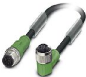
Sensor-/Aktor-Kabel, 8-polig, PVC, schwarz RAL 9005, Stecker gerade M12, Kodierung: A, auf Buchse gewinkelt M12, Kodierung: A, Kabellänge: 0,6 m

Bitte beachten Sie, dass die hier angegebenen Daten dem Online-Katalog entnommen sind. Die vollständigen Informationen und Daten entnehmen Sie bitte der Anwenderdokumentation. Es gelten die Allgemeinen Nutzungsbedingungen für Internet-Downloads. ( http://phoenixcontact.de/download )