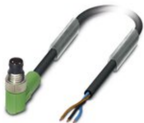
Sensor-/Aktor-Kabel, 3-polig, PVC, schwarz RAL 9005, Stecker gewinkelt M8, auf freies Leitungsende, Kabellänge: 10 m

Bitte beachten Sie, dass die hier angegebenen Daten dem Online-Katalog entnommen sind. Die vollständigen Informationen und Daten entnehmen Sie bitte der Anwenderdokumentation. Es gelten die Allgemeinen Nutzungsbedingungen für Internet-Downloads. ( http://phoenixcontact.de/download )