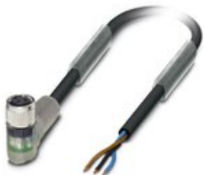
Sensor-/Aktor-Kabel, 3-polig, PVC, schwarz RAL 9005, freies Leitungsende, auf Buchse gewinkelt M8, mit 2 LEDs, Kabellänge: 3 m

Bitte beachten Sie, dass die hier angegebenen Daten dem Online-Katalog entnommen sind. Die vollständigen Informationen und Daten entnehmen Sie bitte der Anwenderdokumentation. Es gelten die Allgemeinen Nutzungsbedingungen für Internet-Downloads. ( http://phoenixcontact.de/download )