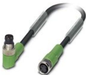
Sensor-/Aktor-Kabel, 3-polig, PVC, schwarz RAL 9005, Stecker gewinkelt M8, auf Buchse gerade M8, Kabellänge: 0,6 m

Bitte beachten Sie, dass die hier angegebenen Daten dem Online-Katalog entnommen sind. Die vollständigen Informationen und Daten entnehmen Sie bitte der Anwenderdokumentation. Es gelten die Allgemeinen Nutzungsbedingungen für Internet-Downloads. ( http://phoenixcontact.de/download )