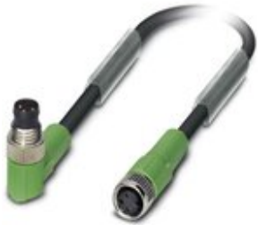
Sensor-/Aktor-Kabel, 3-polig, PVC, schwarz RAL 9005, Stecker gewinkelt M8, auf Buchse gerade M8, Kabellänge: 3 m

Bitte beachten Sie, dass die hier angegebenen Daten dem Online-Katalog entnommen sind. Die vollständigen Informationen und Daten entnehmen Sie bitte der Anwenderdokumentation. Es gelten die Allgemeinen Nutzungsbedingungen für Internet-Downloads. ( http://phoenixcontact.de/download )