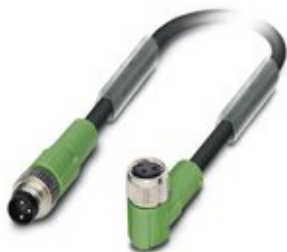
Sensor-/Aktor-Kabel, 3-polig, PVC, schwarz RAL 9005, Stecker gerade M8, auf Buchse gewinkelt M8, Kabellänge: 1,5 m

Bitte beachten Sie, dass die hier angegebenen Daten dem Online-Katalog entnommen sind. Die vollständigen Informationen und Daten entnehmen Sie bitte der Anwenderdokumentation. Es gelten die Allgemeinen Nutzungsbedingungen für Internet-Downloads. ( http://phoenixcontact.de/download )