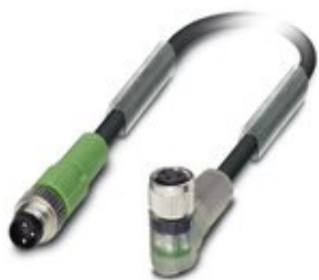
Sensor-/Aktor-Kabel, 3-polig, PVC, schwarz RAL 9005, Stecker gerade M8, auf Buchse gewinkelt M8, mit 2 LEDs, Kabellänge: 0,6 m

Bitte beachten Sie, dass die hier angegebenen Daten dem Online-Katalog entnommen sind. Die vollständigen Informationen und Daten entnehmen Sie bitte der Anwenderdokumentation. Es gelten die Allgemeinen Nutzungsbedingungen für Internet-Downloads. ( http://phoenixcontact.de/download )