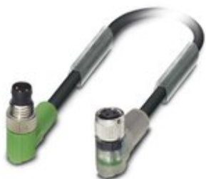
Sensor-/Aktor-Kabel, 3-polig, PVC, schwarz RAL 9005, Stecker gewinkelt M8, auf Buchse gewinkelt M8, mit 2 LEDs, Kabellänge: 0,6 m

Bitte beachten Sie, dass die hier angegebenen Daten dem Online-Katalog entnommen sind. Die vollständigen Informationen und Daten entnehmen Sie bitte der Anwenderdokumentation. Es gelten die Allgemeinen Nutzungsbedingungen für Internet-Downloads. ( http://phoenixcontact.de/download )