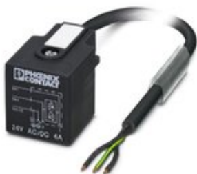
Sensor-/Aktor-Kabel, 3-polig, PVC, schwarz RAL 9005, freies Leitungsende, auf Ventilstecker A, mit 1 LED, beschaltet mit Z-Diode, Kabellänge: 3 m

Bitte beachten Sie, dass die hier angegebenen Daten dem Online-Katalog entnommen sind. Die vollständigen Informationen und Daten entnehmen Sie bitte der Anwenderdokumentation. Es gelten die Allgemeinen Nutzungsbedingungen für Internet-Downloads. ( http://phoenixcontact.de/download )