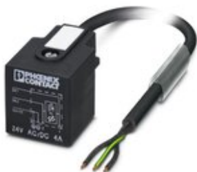
Sensor-/Aktor-Kabel, 3-polig, PVC, schwarz RAL 9005, freies Leitungsende, auf Ventilstecker A, mit 1 LED, beschaltet mit Varistor, Kabellänge: 5 m

Bitte beachten Sie, dass die hier angegebenen Daten dem Online-Katalog entnommen sind. Die vollständigen Informationen und Daten entnehmen Sie bitte der Anwenderdokumentation. Es gelten die Allgemeinen Nutzungsbedingungen für Internet-Downloads. ( http://phoenixcontact.de/download )