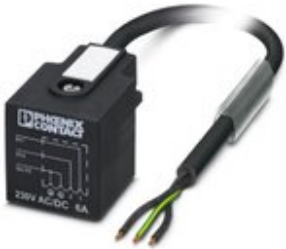
Sensor-/Aktor-Kabel, 3-polig, PVC, schwarz RAL 9005, freies Leitungsende, auf Ventilstecker A, Kabellänge: 1,5 m

Bitte beachten Sie, dass die hier angegebenen Daten dem Online-Katalog entnommen sind. Die vollständigen Informationen und Daten entnehmen Sie bitte der Anwenderdokumentation. Es gelten die Allgemeinen Nutzungsbedingungen für Internet-Downloads. ( http://phoenixcontact.de/download )