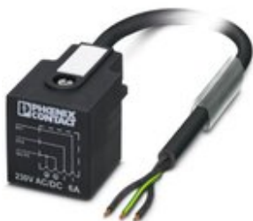
Sensor-/Aktor-Kabel, 3-polig, PVC, schwarz RAL 9005, freies Leitungsende, auf Ventilstecker A, Kabellänge: 3 m

Bitte beachten Sie, dass die hier angegebenen Daten dem Online-Katalog entnommen sind. Die vollständigen Informationen und Daten entnehmen Sie bitte der Anwenderdokumentation. Es gelten die Allgemeinen Nutzungsbedingungen für Internet-Downloads. ( http://phoenixcontact.de/download )