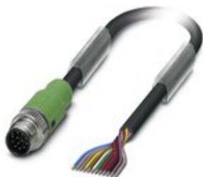
Sensor-/Aktor-Kabel, 12-polig, PUR halogenfrei, schwarz RAL 9005, Stecker gerade M12 SPEEDCON, Kodierung: A, auf freies Leitungsende, Kabellänge: 5 m

Bitte beachten Sie, dass die hier angegebenen Daten dem Online-Katalog entnommen sind. Die vollständigen Informationen und Daten entnehmen Sie bitte der Anwenderdokumentation. Es gelten die Allgemeinen Nutzungsbedingungen für Internet-Downloads. ( http://phoenixcontact.de/download )