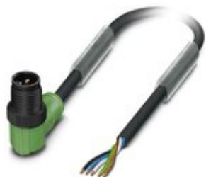
Sensor-/Aktor-Kabel, 5-polig, PUR halogenfrei, schwarzgrau RAL 7021, Stecker gewinkelt M12, Kodierung: A, auf freies Leitungsende, Kabellänge: 10 m, mit Kunststoffrändel

Bitte beachten Sie, dass die hier angegebenen Daten dem Online-Katalog entnommen sind. Die vollständigen Informationen und Daten entnehmen Sie bitte der Anwenderdokumentation. Es gelten die Allgemeinen Nutzungsbedingungen für Internet-Downloads. ( http://phoenixcontact.de/download )