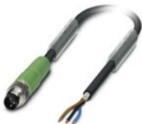
Sensor-/Aktor-Kabel, 3-polig, PUR halogenfrei, schwarzgrau RAL 7021, geschirmt, Stecker gerade M8, auf freies Leitungsende, Kabellänge: 5 m

Bitte beachten Sie, dass die hier angegebenen Daten dem Online-Katalog entnommen sind. Die vollständigen Informationen und Daten entnehmen Sie bitte der Anwenderdokumentation. Es gelten die Allgemeinen Nutzungsbedingungen für Internet-Downloads. ( http://phoenixcontact.de/download )