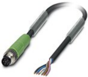
Sensor-/Aktor-Kabel, 6-polig, PUR halogenfrei, schwarzgrau RAL 7021, Stecker gerade M8, auf freies Leitungsende, Kabellänge: 3 m

Bitte beachten Sie, dass die hier angegebenen Daten dem Online-Katalog entnommen sind. Die vollständigen Informationen und Daten entnehmen Sie bitte der Anwenderdokumentation. Es gelten die Allgemeinen Nutzungsbedingungen für Internet-Downloads. ( http://phoenixcontact.de/download )