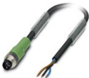
Sensor-/Aktor-Kabel, 3-polig, PUR halogenfrei, schwarzgrau RAL 7021, Stecker gerade M8, auf freies Leitungsende, Kabellänge: 5 m

Bitte beachten Sie, dass die hier angegebenen Daten dem Online-Katalog entnommen sind. Die vollständigen Informationen und Daten entnehmen Sie bitte der Anwenderdokumentation. Es gelten die Allgemeinen Nutzungsbedingungen für Internet-Downloads. ( http://phoenixcontact.de/download )