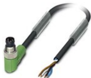
Sensor-/Aktor-Kabel, 4-polig, PUR halogenfrei, schwarzgrau RAL 7021, Stecker gewinkelt M8, auf freies Leitungsende, Kabellänge: 3 m

Bitte beachten Sie, dass die hier angegebenen Daten dem Online-Katalog entnommen sind. Die vollständigen Informationen und Daten entnehmen Sie bitte der Anwenderdokumentation. Es gelten die Allgemeinen Nutzungsbedingungen für Internet-Downloads. ( http://phoenixcontact.de/download )