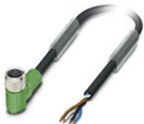
Sensor-/Aktor-Kabel, 4-polig, PUR halogenfrei, schwarzgrau RAL 7021, freies Leitungsende, auf Buchse gewinkelt M8, Kabellänge: 5 m

Bitte beachten Sie, dass die hier angegebenen Daten dem Online-Katalog entnommen sind. Die vollständigen Informationen und Daten entnehmen Sie bitte der Anwenderdokumentation. Es gelten die Allgemeinen Nutzungsbedingungen für Internet-Downloads. ( http://phoenixcontact.de/download )