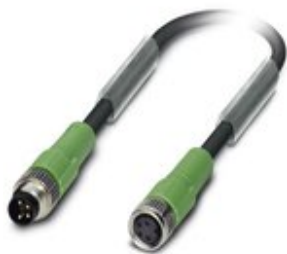
Sensor-/Aktor-Kabel, 4-polig, PUR halogenfrei, schwarzgrau RAL 7021, Stecker gerade M8, auf Buchse gerade M8, Kabellänge: 3 m

Bitte beachten Sie, dass die hier angegebenen Daten dem Online-Katalog entnommen sind. Die vollständigen Informationen und Daten entnehmen Sie bitte der Anwenderdokumentation. Es gelten die Allgemeinen Nutzungsbedingungen für Internet-Downloads. ( http://phoenixcontact.de/download )