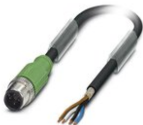
Sensor-/Aktor-Kabel, 4-polig, PUR halogenfrei, schwarzgrau RAL 7021, geschirmt, Stecker gerade M12, Kodierung: A, auf freies Leitungsende, Kabellänge: 1,5 m

Bitte beachten Sie, dass die hier angegebenen Daten dem Online-Katalog entnommen sind. Die vollständigen Informationen und Daten entnehmen Sie bitte der Anwenderdokumentation. Es gelten die Allgemeinen Nutzungsbedingungen für Internet-Downloads. ( http://phoenixcontact.de/download )