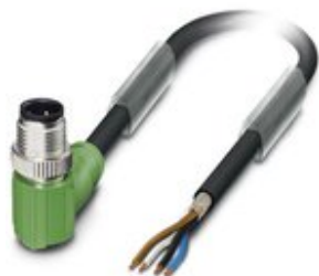
Sensor-/Aktor-Kabel, 4-polig, PUR halogenfrei, schwarzgrau RAL 7021, geschirmt, Stecker gewinkelt M12, Kodierung: A, auf freies Leitungsende, Kabellänge: 5 m

Bitte beachten Sie, dass die hier angegebenen Daten dem Online-Katalog entnommen sind. Die vollständigen Informationen und Daten entnehmen Sie bitte der Anwenderdokumentation. Es gelten die Allgemeinen Nutzungsbedingungen für Internet-Downloads. ( http://phoenixcontact.de/download )