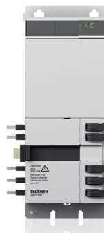
AX8118 | Achsmodul, 18 A