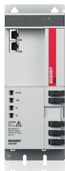
AX8640 | Einspeisemodul, 40 A