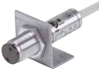
Sensor im Montagehalter montiert

Mit Hilfe des Montagehalters können zylindrische Sensoren schnell und einfach montiert werden. Benutzen Sie zum Befestigen die Muttern aus dem Lieferumfang des Sensors.