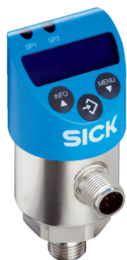
Rysunek może się różnić