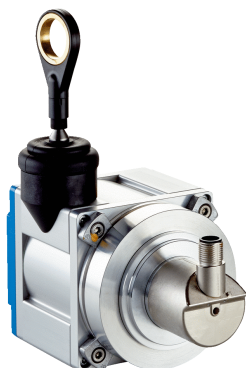
Rysunek może się różnić