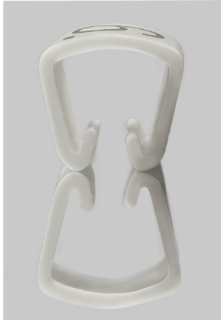
Podobny do przedstawionego na ilustracji