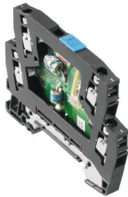
Podobny do przedstawionego na ilustracji