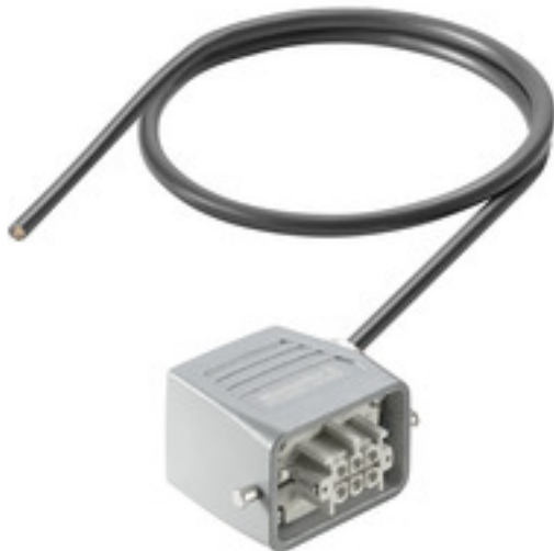
Product similar to the picture

Промышленный мир, в котором все больше применяются сетевые технологии, идет рука об руку с модуляризацией устройств и систем. Функции все чаще переносятся из шкафа электроуправления на место эксплуатации, что увеличивает количество требуемых кабелей.