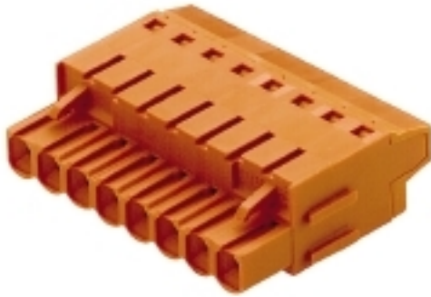
150246 BLT 5.08/ 8B SN OR