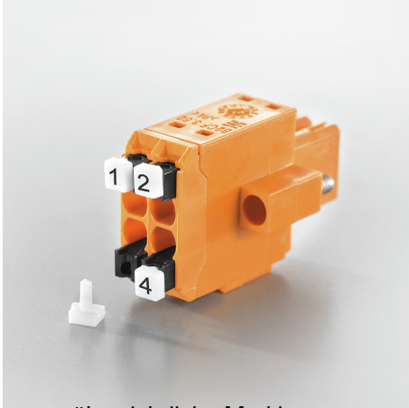
übersichtliche Markierung Eindeutige Bezeichnung