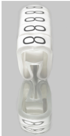
Podobny do przedstawionego na ilustracji